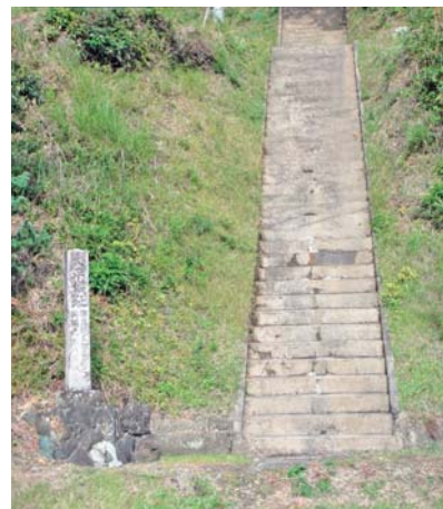
おいだいら 大平城跡 (浜北区大平)