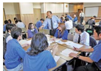
楽しくコンセンサスゲーム

午後からは1つのテーマについてグループに分かれて意見をまとめる、コンセンサスゲームを行いました。苦戦しながらも、日頃の仕事とはまったく違う脳を働かせて答えを出す作業を楽しめたのではないのでしょうか?