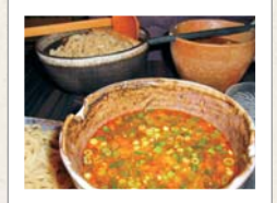
● 麺屋 山彦